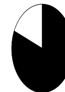
Share of global population, 2006