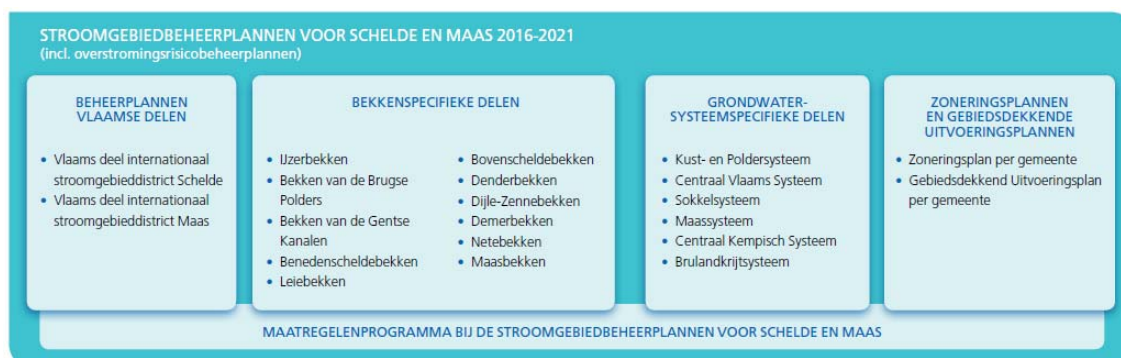
Figuur 2 De stroomgebiedbeheerplannen voor Schelde en Maas (2016-2021) bestaan uit verschillende planonderdelen.

In de beheerplannen voor het Vlaamse deel van de internationale stroomgebieddistricten van Schelde en Maas wordt de huidige toestand van het water beschreven en geanalyseerd. De focus ligt op de grotere waterlopen en de kanalen.