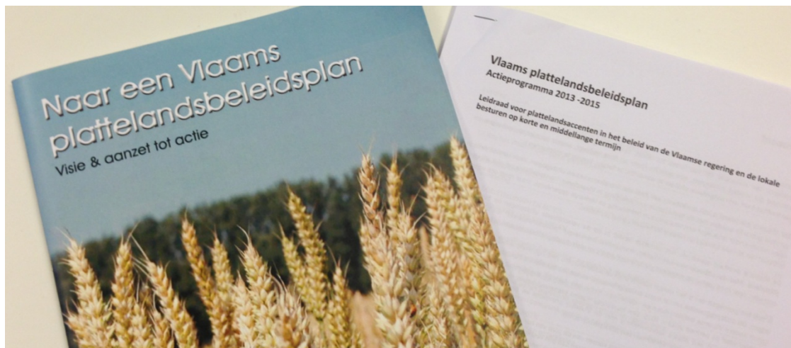
Figuur 1 - Het actieprogramma 2013-2015 en "Naar een Vlaams plattelandsbeleidsplan" vormen samen het Vlaams plattelandsbeleidsplan.

Het actieprogramma 2013-2015 en "Naar een Vlaams plattelandsbeleidsplan" vormen samen het Vlaams plattelandsbeleidsplan. Het beleidsveld plattelandsbeleid is een jong beleidsveld. In de periode 2005-2009 voerde VLM (Vlaamse Landmaatschappij), een extern verzelfstandig agentschap binnen het beleidsdomein Leefmilieu, Natuur en Energie, het project "Plattelandsbeleid, een gezamenlijk innovatieproces" uit. Dit project, dat bestond uit een literatuuronderzoek en de bevraging van verschillende bestuursniveaus en het middenveld resulteerde in het document " Naar een Vlaams plattelandsbeleidsplan ". De daaropvolgende jaren (2010-2012) werd het document verder uitgewerkt met een update van de visietekst, bevraging van en overleg met de Vlaamse beleidsdomeinen en denktanks in samenwerking met de lokale besturen. Dit traject resulteerde in het actieprogramma 2013-2015 van het Vlaams plattelandsbeleid dat nu ter advies voorligt.